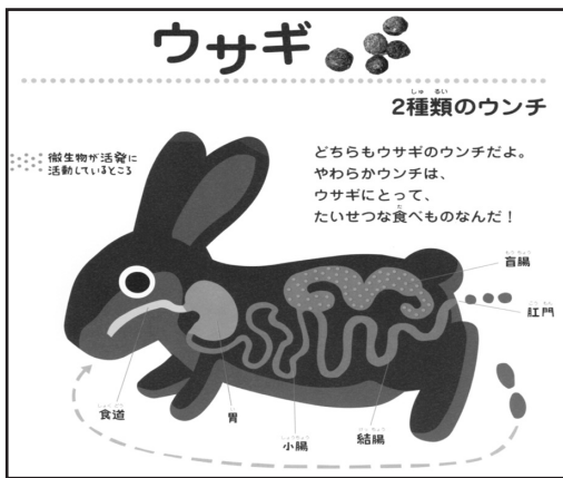
絵図2 『ずら〜りウンチ』

『ずら〜りウンチ』は、身近な動物の胃や腸の働きが詳しく描かれており、食物が体の中を通過していく消化管の模式図は、動物の生態を知る第一歩となったようである。なかでもキリンやウシなど草食動物の「反すうの仕組み」が、不思議に思えるのか、胃から口に戻すことについては、興味・関心を示し聞き直す子どももいた。また、ウサギの絵は好評で2種類のウンチ、絵図2の解説をしたが、ウンチを食べることは意外のようで、その姿を見たとき喜んでいて、