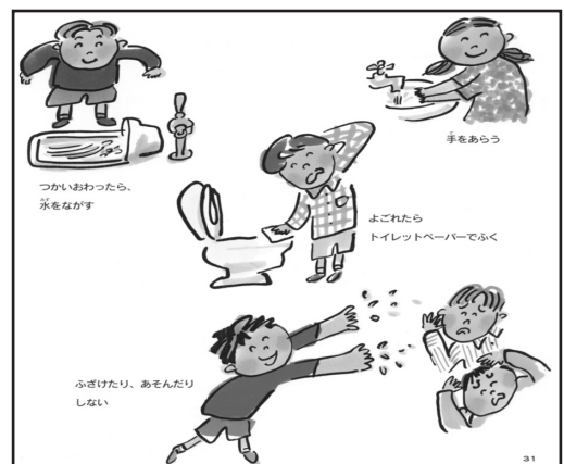
絵図4 『うんちのえほん』トイレマナー

『うんちのえほん』のトイレマナーで絵図4について解説していると、反射的に「わかっている」といい余り関心を示さなかった。また、女兒が言っていたように「流してない」事例や便器の汚れもあり、学校のトイレというと、嫌な場面を思い出すようで適切な環境とは言えない。これらトイレの汚れや失敗は、本人にとっても、次の人にとってもショッキングな出来事になるので、普段から対処法をスキルとして教えておくことが大切である。この場合のスキルとは、洋式・和式便器とも周囲を汚したときは、紙を使って自分で始末をすること、そして手についてしまっても病気などに感染することはないこと、使用後きちんと手を洗うことなどを家庭でも幼児時期から見本を示し一緒に行うことである。