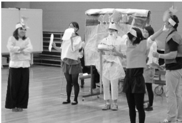
(写真6 十二支の由来)