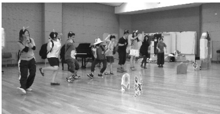
(写真4 おばけの森：創作作品)