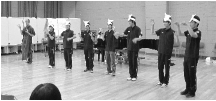
(写真5 おおかみと7匹の子やぎ)