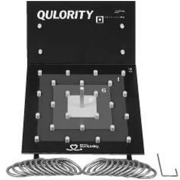
図5 クロリティー用具

クロリティーは、共同研究者の一人である石川が生涯にわたる健康づくりの視点からニューコンセプト・スポーツ（いつでも、どこでも、だれとでも、楽しく安全に行えるスポーツ）として1988年に研究開発したスポーツ輪投げである。競技の方法は、まず、順番をきめ、ポートに向かい、3メートル、5メートル、7メートル、9メートルの距離から1人約200グラムのゴム製のリング10個を1投ずつ交互に投げて得点を競うスポーツである。