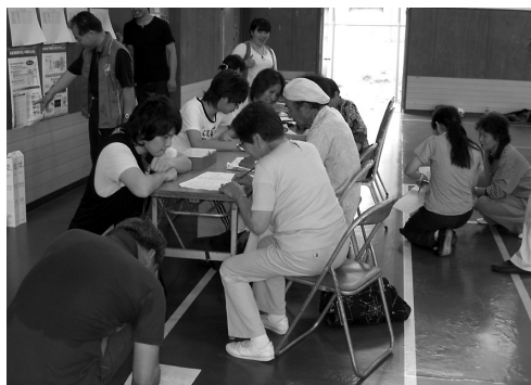
図2 アンケート調査

大会開催時に本研究の主旨と手続きを説明した後、質問紙を配布し、大会終了後、質問紙の回収と身体計測として血管老化度の計測を行った。