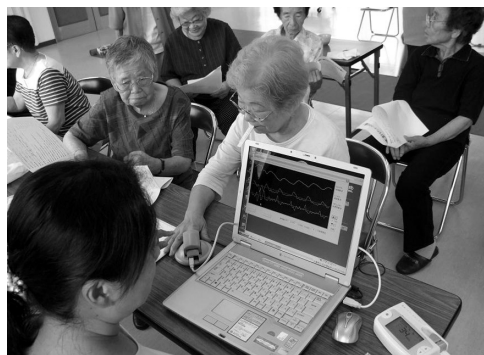
図3 血管老化度測定