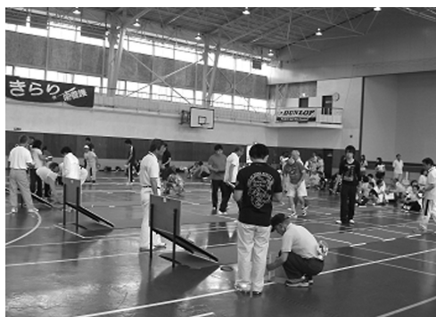
図1 A県クロリティー選手権大会