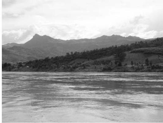
写真1 ラオス山間部中流域のメコン川