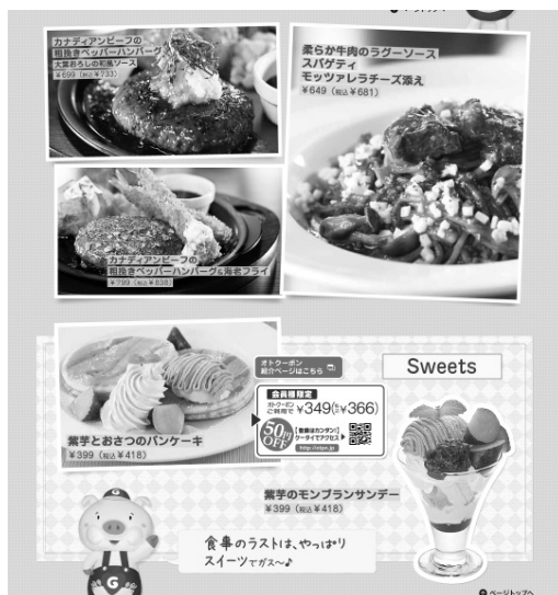
[ 10 ]

ガストは洋食中心のレストランであるため、カタカナのメニューが多くなることが予想される。どの程度がカタカナなのか、カタカナ以外の表示はどのようなものがあるのか。すべてカタカナ語以外にすると、どのようなメニューになるだろうか。より注文したくなるメニューを考えてみよう。