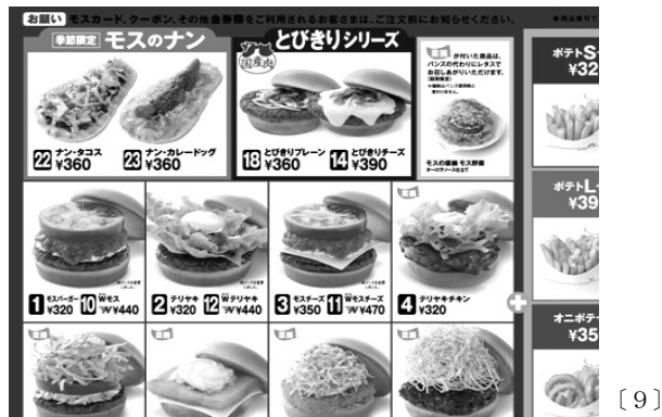
[ 9 ]

メニューにある商品名は、ほとんどがカタカナで、日本語はごく一部に限られていることに気付く。バーガーは元々アメリカの食べ物であり、基本の商品名はカタカナになることは想像できるが、どのくらいがカタカナなのか、またどの部分が日本語のままか。メニューをすべて日本語にしたらどうなるだろうか。カタカナのメニューとそうでないメニュー、どちらをより注文したいですか？